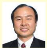
ソフトバンクグループ株式会社 代表取締役会長 兼 社長 孫 正義 氏