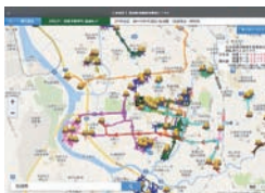
利用者が確認できる情報例 (除排雪車両の稼動履歴と現在地)