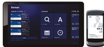
サービスの利用画面