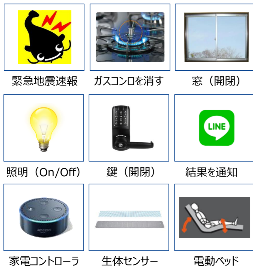
【異なるメーカーのモノやサービス】