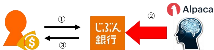
①通貨/積立金額を事前設定 ②積立実行シグナル ③外貨積立購入実行