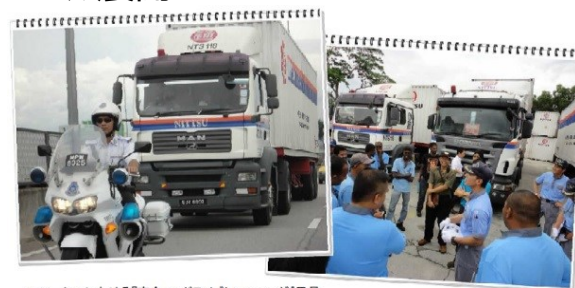
マレーシアにおける『安全エコドライブトレーニング』風景