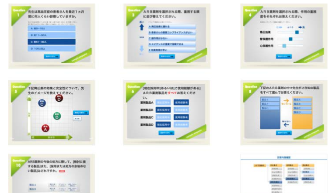
HTML 5 を利用した、動的な画面設計