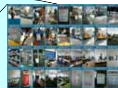
タイムスタンプ (年月日時刻の自動表示)

Copyright 2007, Nippon COMSYS Corp. All rights reserved.